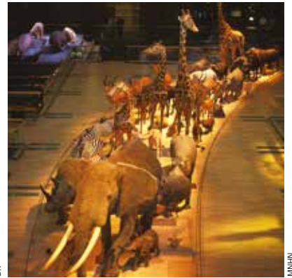
► La Grande Galerie de l'évolution au Muséum.

Si vous rêvez d'un bon thé à la menthe et de douceurs sucrées, prenez la première à gauche, rue de Quatrefages, pour rejoindre la GRANDE MOSQUÉE DE PARIS 4 . Sinon, continuez jusqu'à la rue de Navarre, qui vous conduira aux ARÈNES DE LUTÈCE 5 . Là, profitez du calme ! On ne dirait pas, mais cet amphithéâtre gallo-romain du 1 er siècle, l'un des plus anciens sites de Paris, pouvait contenir jusqu'à 17 000 personnes !