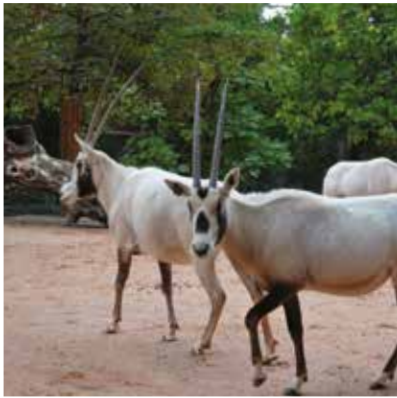
► La ménagerie du Jardin des plantes.