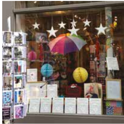
► La librairie la Petite Boucherie.