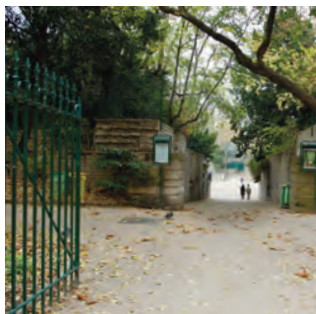
5 Les arènes de Lutèce