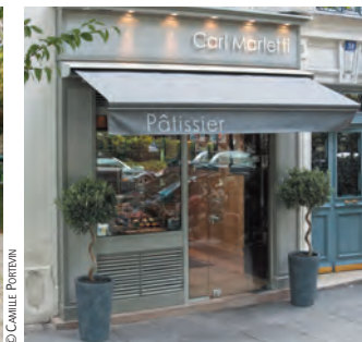
9 La pâtisserie Carl Marletti