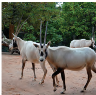
1 La ménagerie du Jardin des Plantes