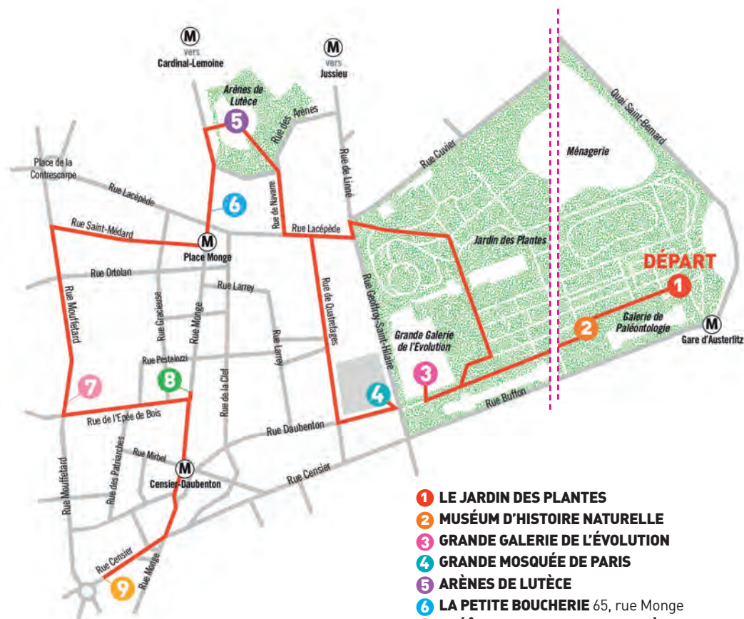
6 La librairie la Petite Boucherie