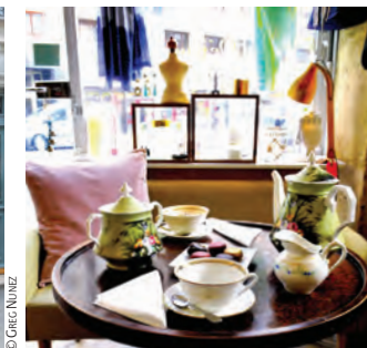
8 Le salon de thé Aux Cerises de Lutèce